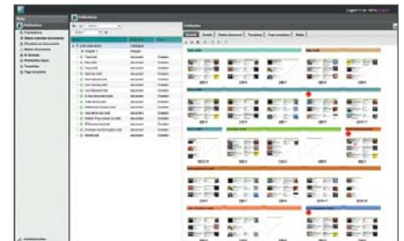
priint:planner: Effizientes Management von Print-Publikationen Inhaltliche Zusammenstellung von Publikationen

Die nicht lineare Formatadaption erlaubt es, InDesign® Dokumente in ihren Größenverhältnissen automatisch zu verändern. Einsatzgebiete sind u.a. Anzeigen, Labels, Instore Kommunikation oder Layoutanpassungen für die digitale Ausgabe.